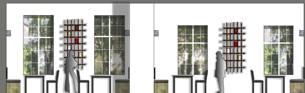
INNENANSICHT - HAUPTFLÜGEL m 1:100 - BISTRO